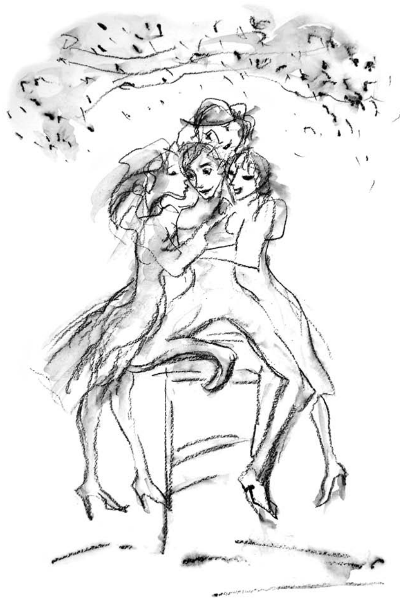
Ilustracija, Nada Žiljak

Više znam nego psiholozi, više od muške polovice braka zavide mi i vrhumski ginekolozi, jer...ja sam švercer higijenskih uložaka.