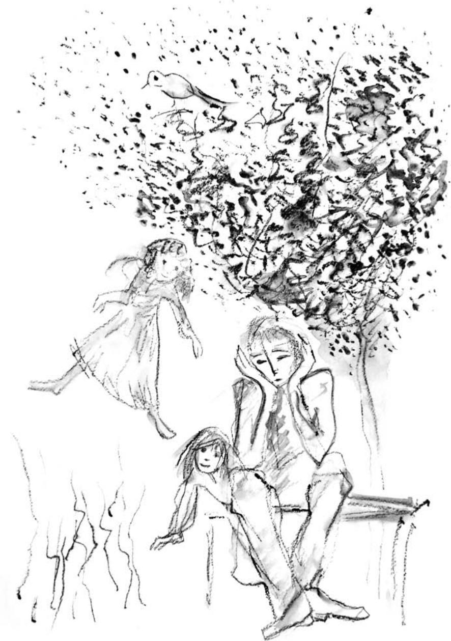
Ilustracija, Nada Žiljak

Gospodine Bože, spasi me da u mržnju ne tonem, Gospodine Bože, osnaži me da u nadi ne klonem.