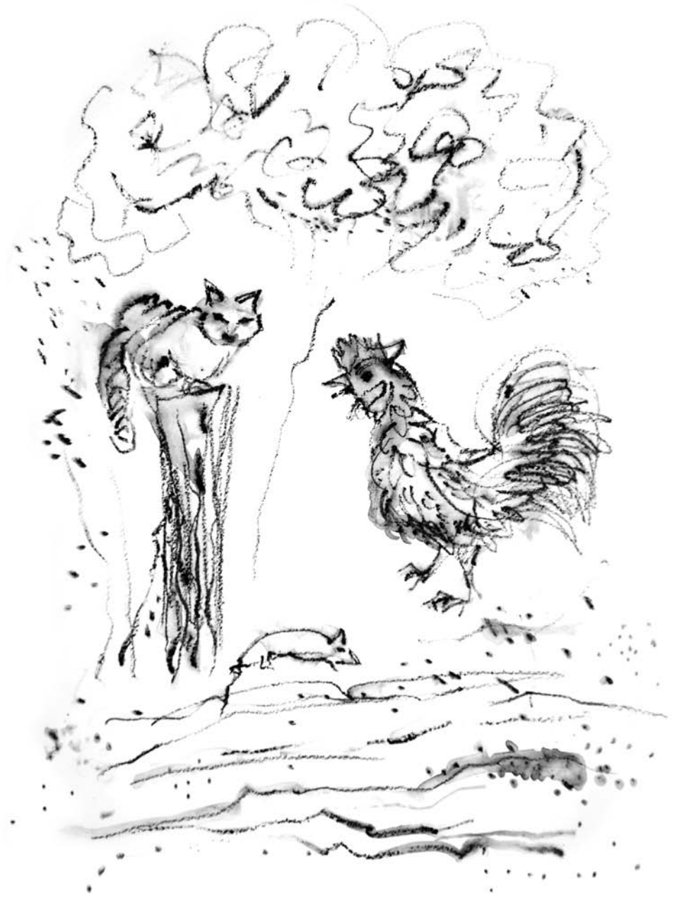
Ilustracija, Nada Žiljak

Tak te počinje sake jutre, v sakem je tak novem letu i čim se zbudi den zjutre otpreš oči i opet si v svom težačkem svetu.