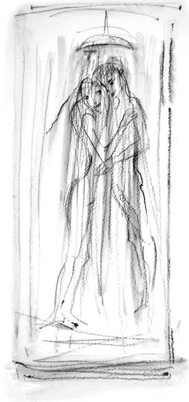
Ilustracija, Nada Žiljak