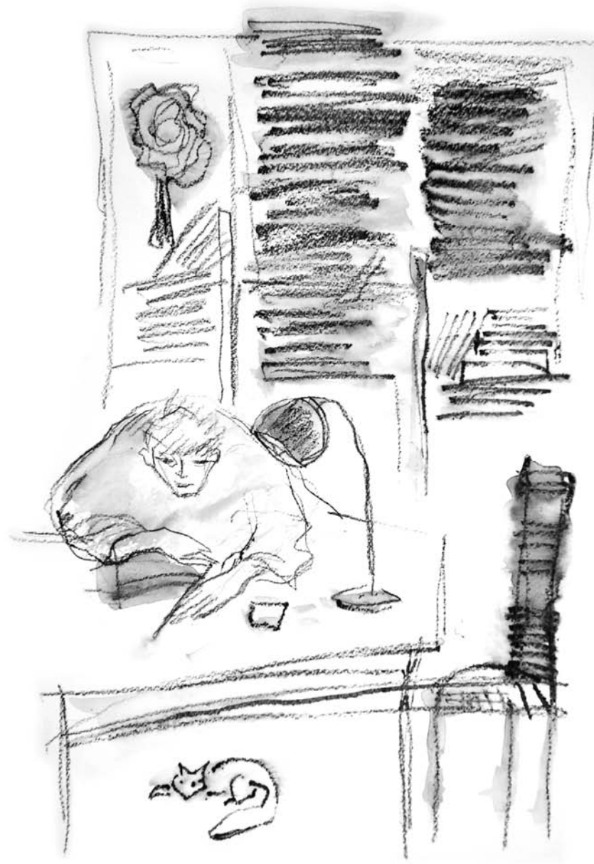
Ilustracija, Nada Žiljak