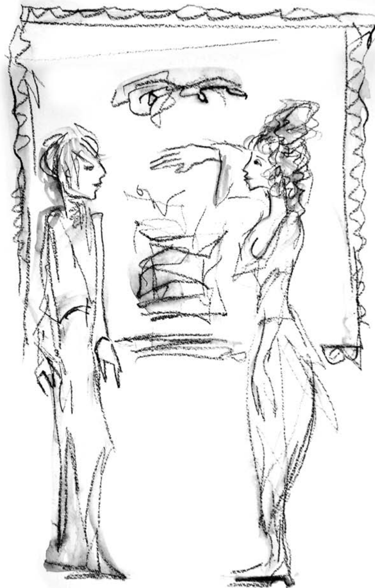
Ilustracija, Nada Žiljak

I onda se dogodi bljesak, munja, tresak groma u trenutku kada se pogledi spoje, tlo pod nogama nestaje, prošlost se slama u beskonačnosti Svemira jer našli se... njih dvoje.