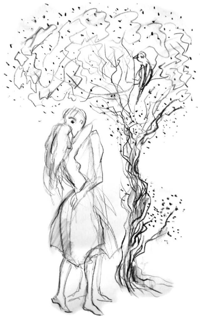
Ilustracija, Nada Žiljak

Nije mi jasno ni sada kada su kiše izbrisale posljednje tragove našeg svijeta. Da li si možda voljela mene kao pozlaćeni oltar svojih želja ili kao malenu kišnu kap što se slučajno našla na tvom mekom dlanu i namjerno je zadržala u ruci nježno je stisnula čekajući da ishlapi pod toplinom tvoga tijela. Nije mi jasno. I pitam se da li si možda voljela moju crnu indijsku košulju s malim džepom na rukavu ili švicarski sat marke "Tisot" zbog dizajna i visoke cijene koji sam kupio pod švercom. Nije mi jasno. I prosto ne mogu da shvatim, jer mnogo toga između mene i Tebe ostalo je nedorečeno bačeno u tamne dubine provalije što nas dijeli